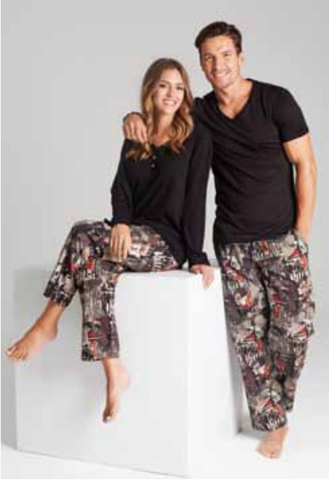
Loyal Boyfriend : CLARIOUS Sadık Erkek arkadaş...